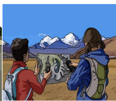
zài chéng jiāo 在城郊