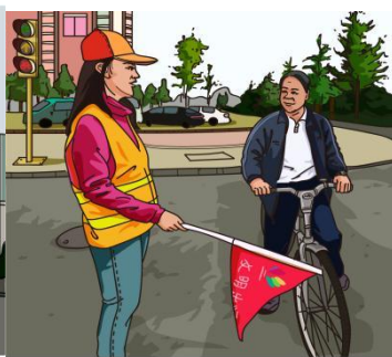
zài lù shàng 在路上