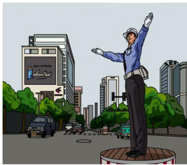
zài jiē dào shàng 在街道上

What will you do if you get lost in the following situations?